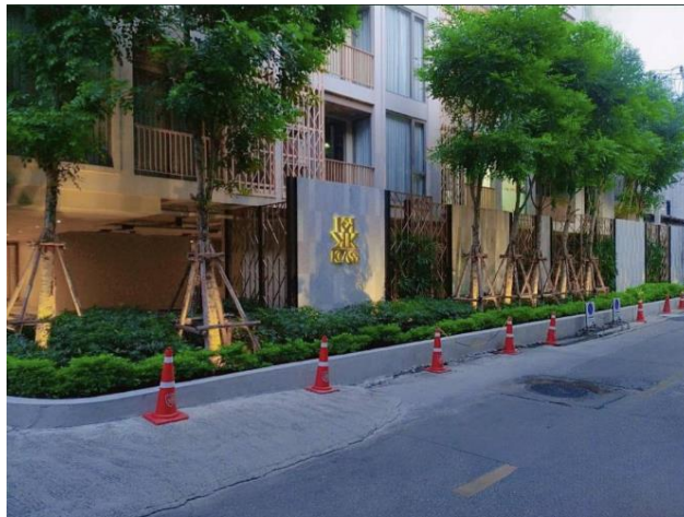
รูปที่ 2-1 แบบจำลองอาคารโครงการ

โครงการ KLASS Siam ของนิติบุคคลอาคารชุดคลาส สยาม เป็นโครงการก่อสร้างอาคารชุดพักอาศัยความสูง 8 ชั้นและชั้นใต้ดิน 3 ชั้นจำนวน 1 อาคาร (รูปที่ 2-1) ตั้งอยู่ที่ซอยเกษมสันต์ 2 ถนนพระรามที่ 1 แขวงวังใหม่ เขตปทุมวันกรุงเทพมหานคร ที่ตั้งโครงการและเส้นทางการเดินทางเข้าสู่พื้นที่โครงการสรุปได้ดังนี้ (รูปที่ 2-2)